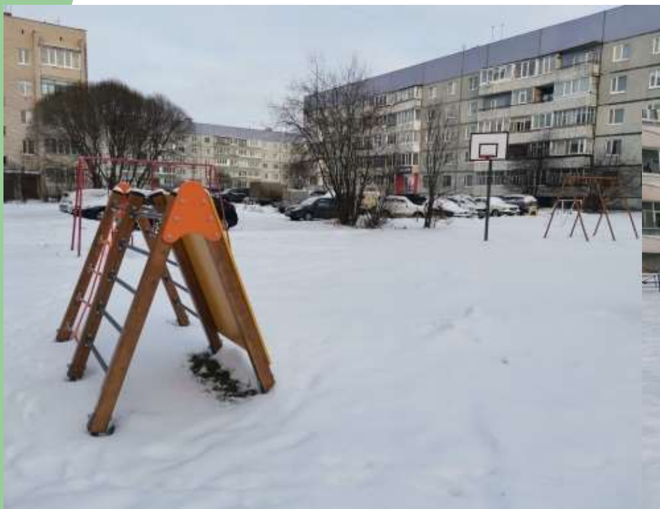
Детская площадка во дворе дома №70 по улице Советской