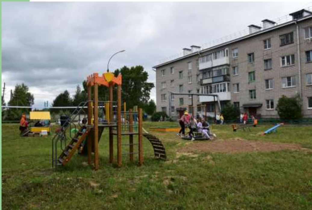
Детская площадка г. Кадников