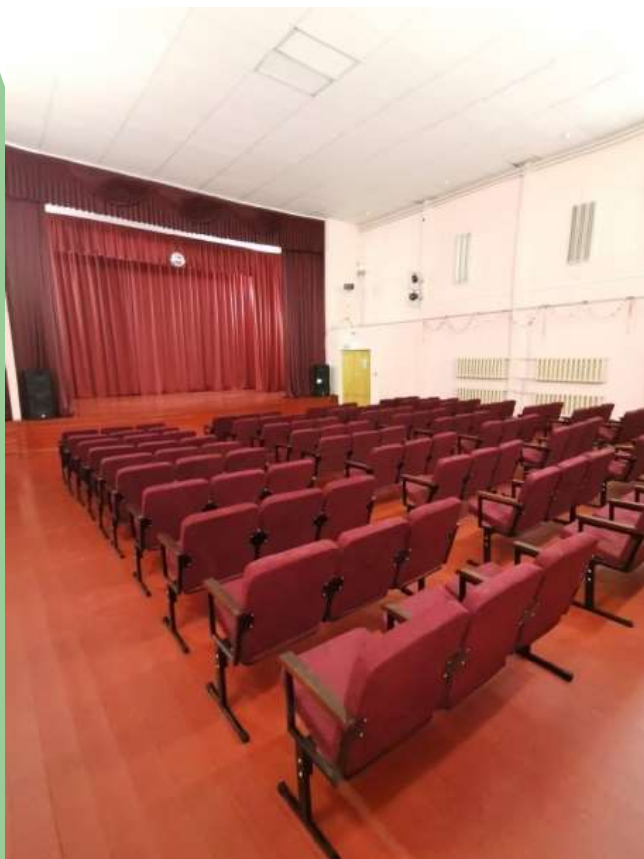
Трехсекционные кресла в Биряковском Доме культуры