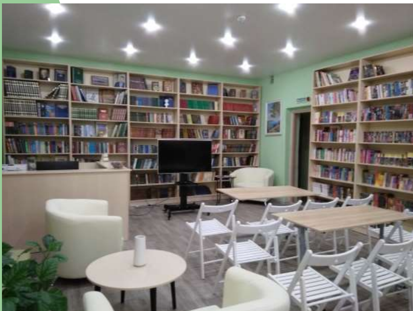
Мебель в сельскую библиотеку д. Литега