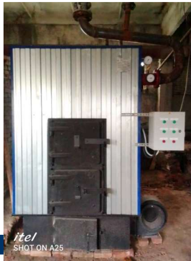
Оборудование для котельной села Биряково