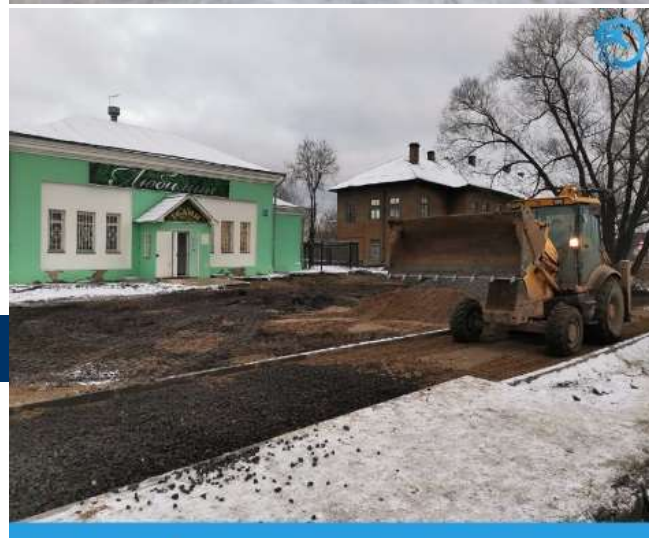
Тротуар по улице Советской у дома №104