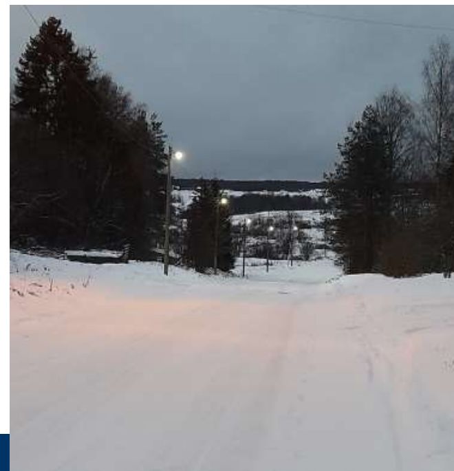
Уличное освещение по ул. Ветеранов д. Чекшино