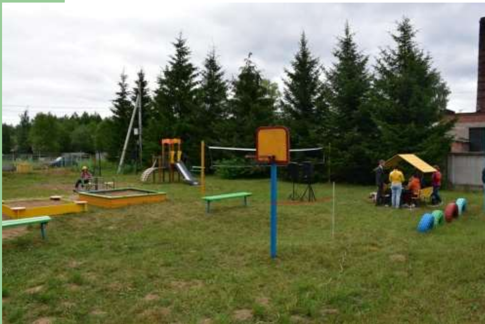
Детская площадка во дворе ул. Луковецкая, д.4