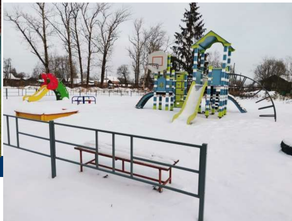
Детская площадка во дворе ул. Луковецкая, д.4