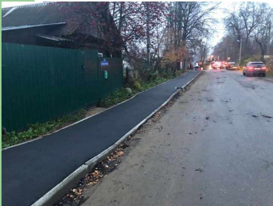
Тротуар по улице Карла Маркса г. Кадникова