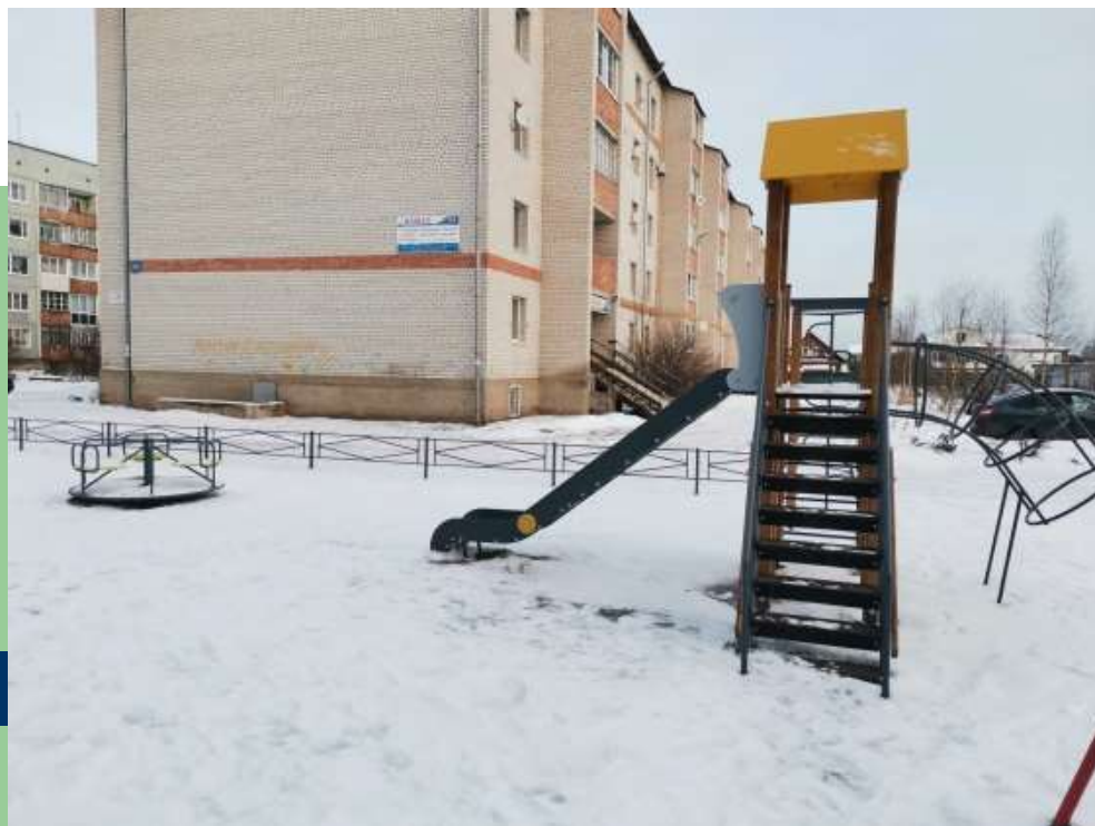
Детская площадка во дворе дома №74 по улице Советской