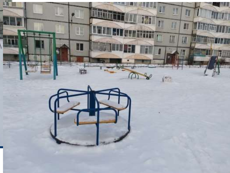
Детская площадка во дворе дома №66 по улице Советской